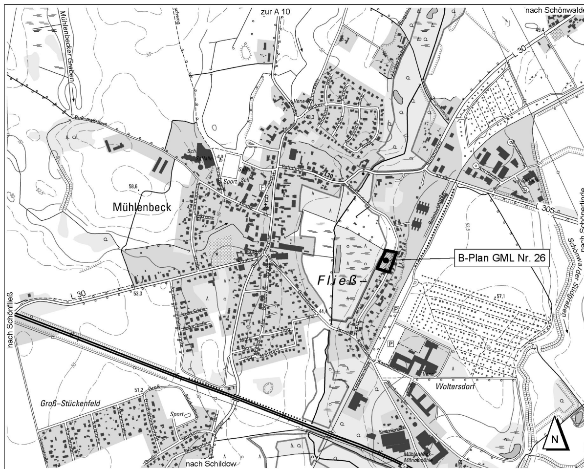
Abb. 2: Lage des Plangebietes

Auf der Fläche des Plangebietes befindet sich im südöstlichen Drittel das Wohngebäude Woltersdorfer Straße 15, die Fläche nördlich davon stellt sich als unbebaute Rasenfläche dar.