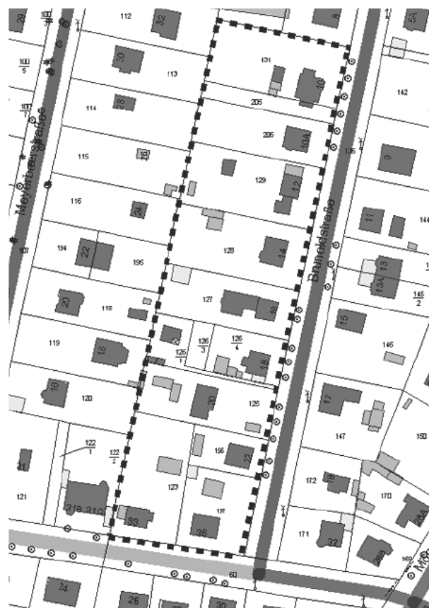
Grenze des Geltungsbereiches B-Plan GML Nr.7 „Westliche Brunoldstr.“, OT Schildow