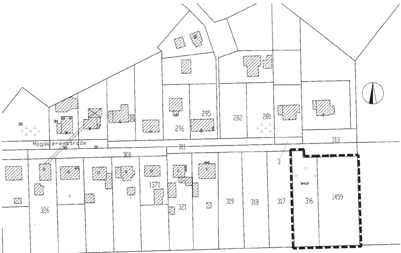
Auszug aus der Liegenschaftskarte mit Umgrenzung des Plangebietes

Das Plangebiet umfasst die Flurstücke 316 und 1459 der Flur 18 der Gemarkung Schildow mit einer Größe von insgesamt ca. 0,31 ha. Der Geltungsbereich wird begrenzt durch die Magdalenenstraße im Norden sowie durch den angrenzenden Landschaftsraum im Osten, Süden, und Westen.