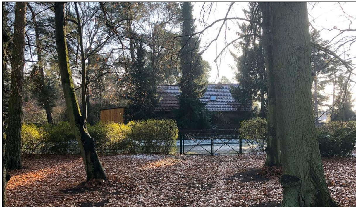
Einfahrt des Grundstücks Bahnhofstraße Nr. 11 in Richtung Bahnhofstraße

In der Ergänzungsfläche regeln sich die dort mögliche Bebauung und die zulässige Nutzung nach den Regelungen des § 34 Abs. 1 und 2 BauGB im Sinne des Gebotes der Einfügung der neuen Bebauung in Art der baulichen Nutzung der Umgebung. Die Art der baulichen Nutzung in der Nachbarschaft der Ergänzungsfläche entspricht dem Charakter eines allgemeinen Wohngebietes gemäß § 4 BauNVO.