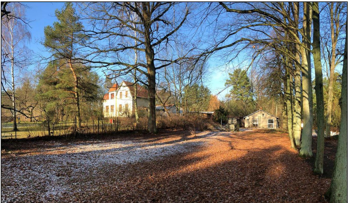
Blick auf die Grundstücke Bahnhofstraße Nr. 11 (rechts bzw. vorne) und Nr. 10 (links bzw. hinten) von Süden

Das Plangebiet steigt nach Norden und Westen leicht an und ist mit einigen großen Bäumen bewachsen. Auf dem Grundstück Bahnhofstraße Nr. 10 befindet sich ein freistehendes, von der Bahnhofstraße abgerücktes Wohngebäude (Villa) mit weiteren Nebengebäuden dahinter und an der östlichen Grundstücksgrenze. Das benachbarte Grundstück Bahnhofstraße Nr. 11 ist bisher mit einem eingeschossigen Wochenendhaus und weiteren Nebenanlagen bebaut, die jahrelang leer standen und in einem sehr schlechten Zustand sind. Der vordere Teil der Grundstücke ist jeweils frei von Bebauung. Die Grundstücke weisen einen teils hochwertigen Gehölzbestand (mehrere hochwüchsige Linden und Eichen sowie vereinzelt Birken, Kiefern und Fichten) auf, der insbesondere im vorderen Grundstücksbereich erhalten bleiben soll. Beide Grundstücke verfügen über jeweils eine Zufahrt zur Bahnhofstraße hin. Die Umgebung der Ergänzungsfläche wird überwiegend von freistehenden, ein- bis zweigeschossigen Einfamilienhäusern und lockerem Gehölzbewuchs geprägt.