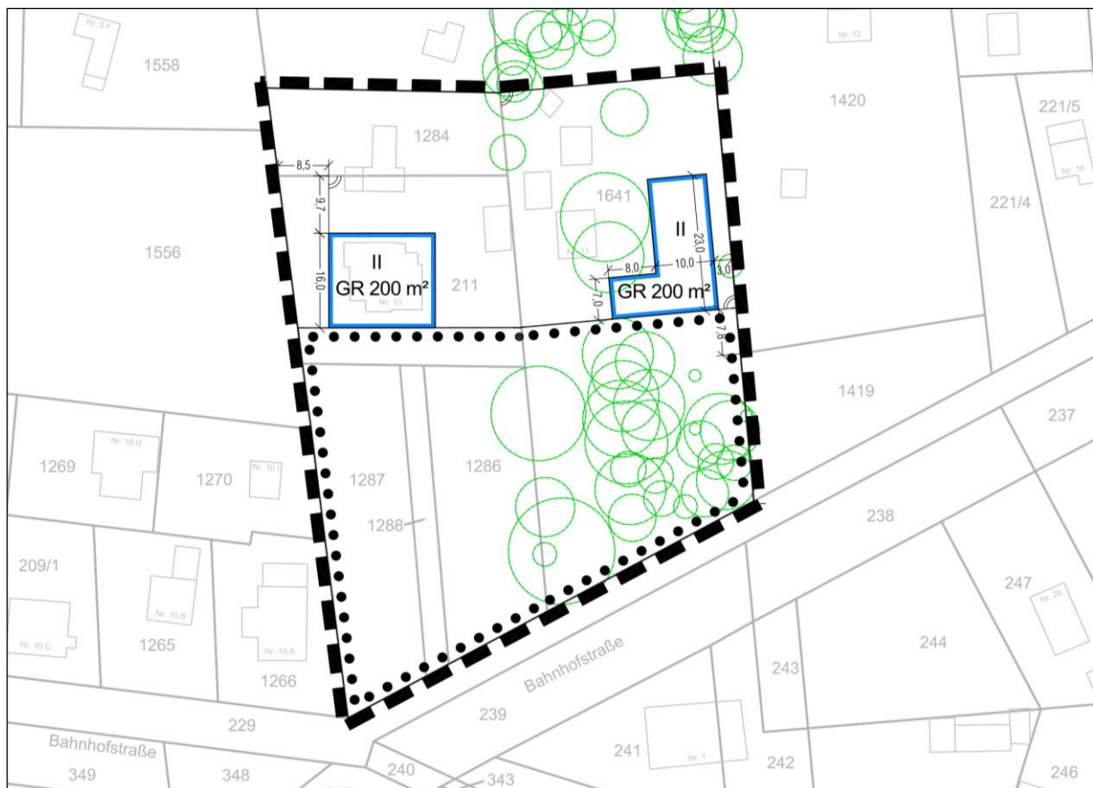
Planzeichnung (Entwurf) mit Baumbestand auf Grundstück Bahnhofstraße Nr. 11

Die überbaubare Grundstückfläche wird gemäß § 23 Abs. 3 BauNVO durch Baugrenzen festgesetzt. Durch die Festsetzung von größeren Baufenstern als die zulässige Grundfläche wird zum Einen die bestehende Bebauung auf dem Grundstück Nr. 10 berücksichtigt und zum Anderen eine ausreichend flexible Neubebauung auf dem Grundstück Nr. 11 ermöglicht. Dabei werden die zu erhaltenden Freiflächen mit den bestehenden Bäumen auf den vorderen Grundstücksbereichen ausgespart, ebenso wird nach hinten eine ausreichende Fläche als Garten freigehalten. Auf dem östlichen Baugrundstück Nr. 11 wird zudem auch der Baumbestand im hinteren Grundstücksbereich berücksichtigt, so dass dieser voraussichtlich ebenfalls erhalten bleiben kann. Die sich daraus ergebende Gebäudestellung sieht einen Baukörper vor, der im Wesentlichen parallel zur östlichen Grundstücksgrenze ausgerichtet ist. Diese Anordnung der überbaubaren Grundstückfläche ist mit dem Grundstückbesitzer abgestimmt.