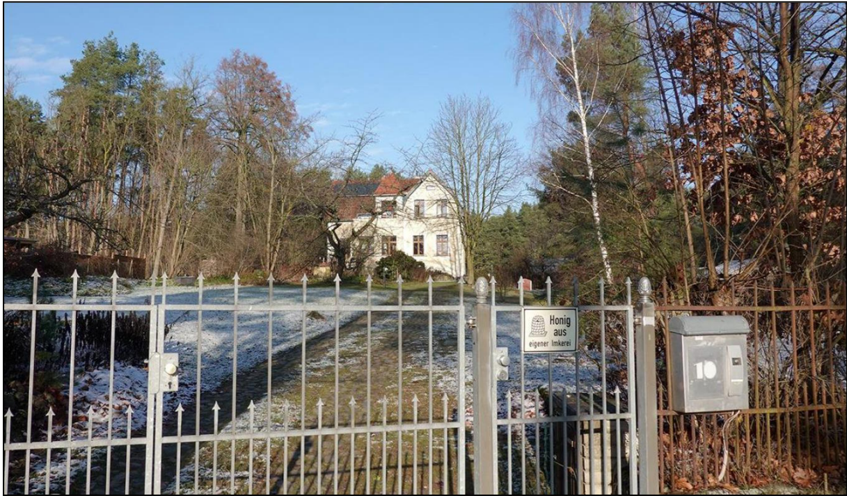
Blick auf das Grundstück Bahnhofstraße Nr. 10 von Süden (aus Richtung Bahnhofstraße)