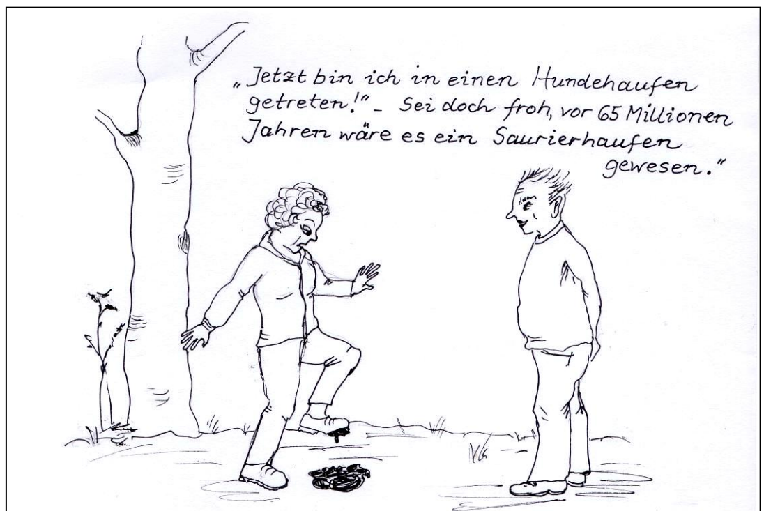
Illustration: Erika Cipper

Gegründet wurde die Volkssolidarität 1945 mit dem Anliegen, soziale Not und Elend nach dem Ende des Krieges zu lindern. Der Verband hat eine lange Tradition des sozialen Engagements für ältere Menschen, chronisch Kranke, Pflegebedürftige, sozial Benachteiligte und für Kinder und Jugendliche. Seit der Gründung ist der Grundwert Solidarität Leitmotiv des Wirkens des Verbandes.