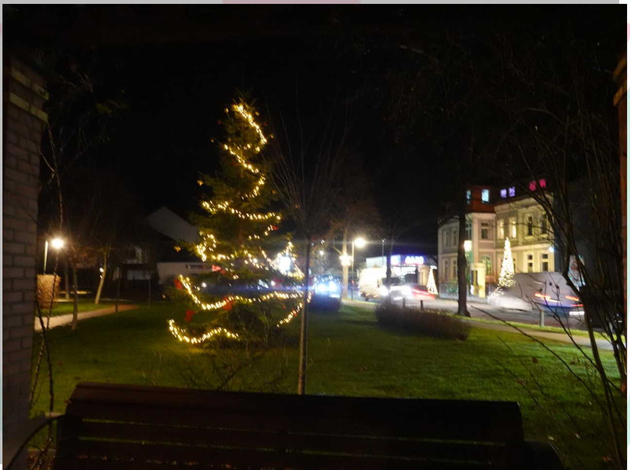
Foto: Ortskern Mühlenbeck

Herausgegeben von der Ortsgruppe Mühlenbeck Volkssolidarität