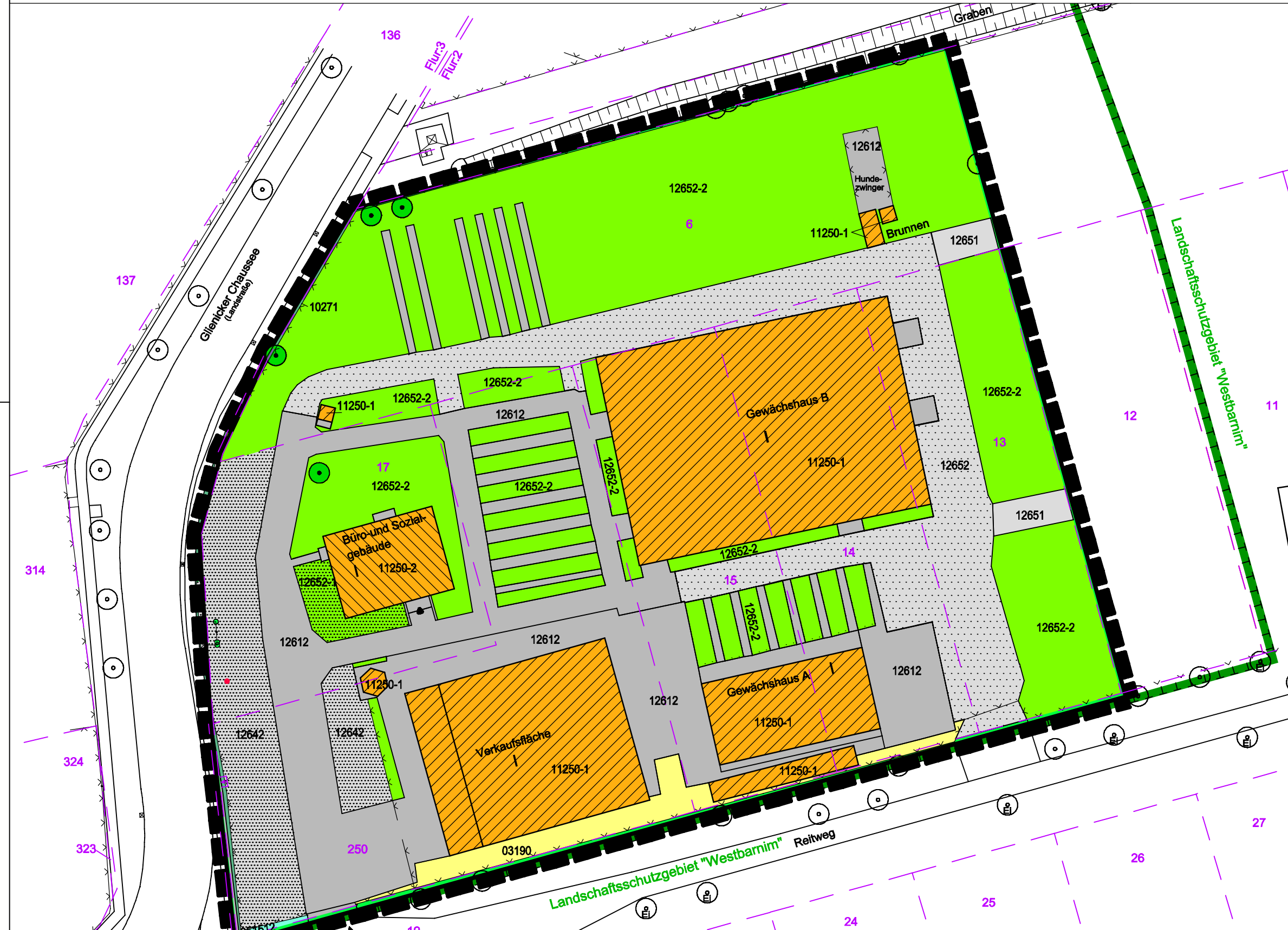
Zusammenstellung der Biotoppotenziale im Plangebiet des vorhabenbezogenen Bebauungsplanes nach dem Eingriff Nach Biotopkartierung Brandenburg - Liste der Biotopkartierung, Stand 2011

Nach Biotopkartierung Brandenburg - Liste der Biotopkartierung, Stand 2011