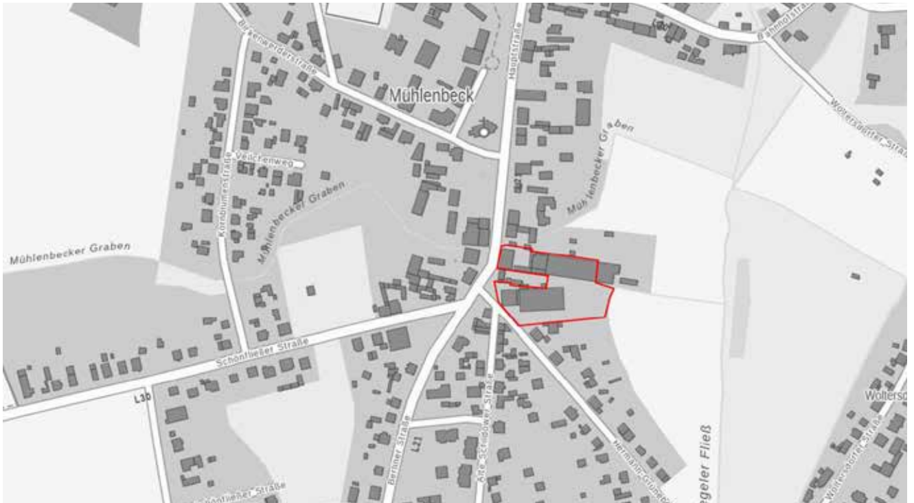
Lage des Plangebietes im Ortsteil Mühlenbeck, o. M.