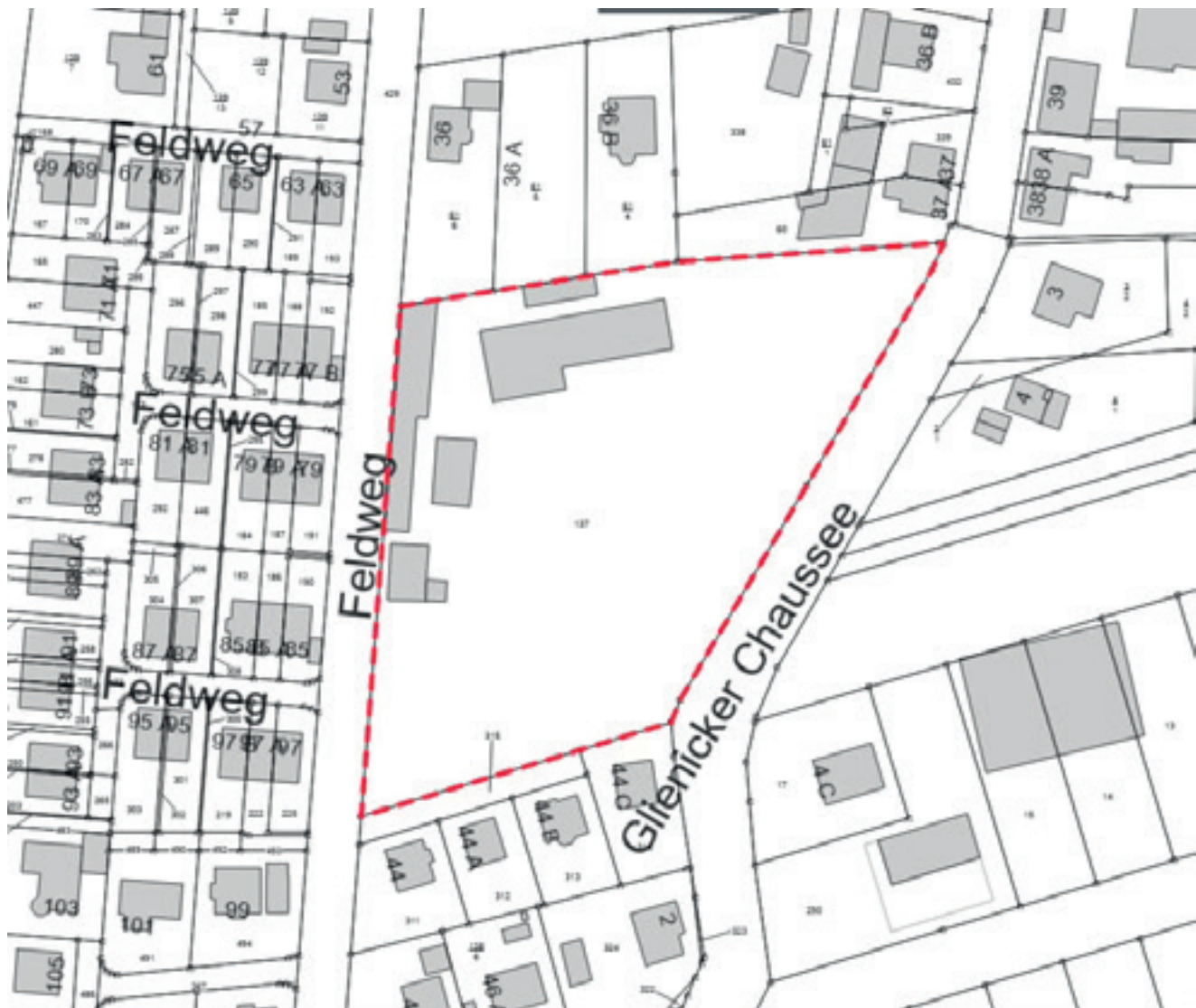
Darstellung Geltungsbereich GML Nr. 64